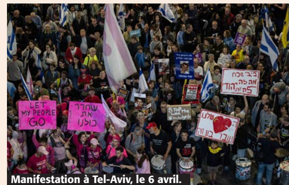
Manifestation à Tel-Aviv, le 6 avril.

Les manifestations pour exiger un cessez-le-feu en Israël