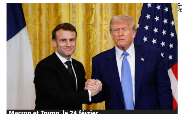
Macron et Trump, le 24 février.

La décision de Trump de négocier avec Poutine... et les réactions qu'elle suscite en France