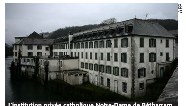
L'institution privée catholique Notre-Dame de Bétharram.

Ce régime corrompu permet et protège les Bétharram