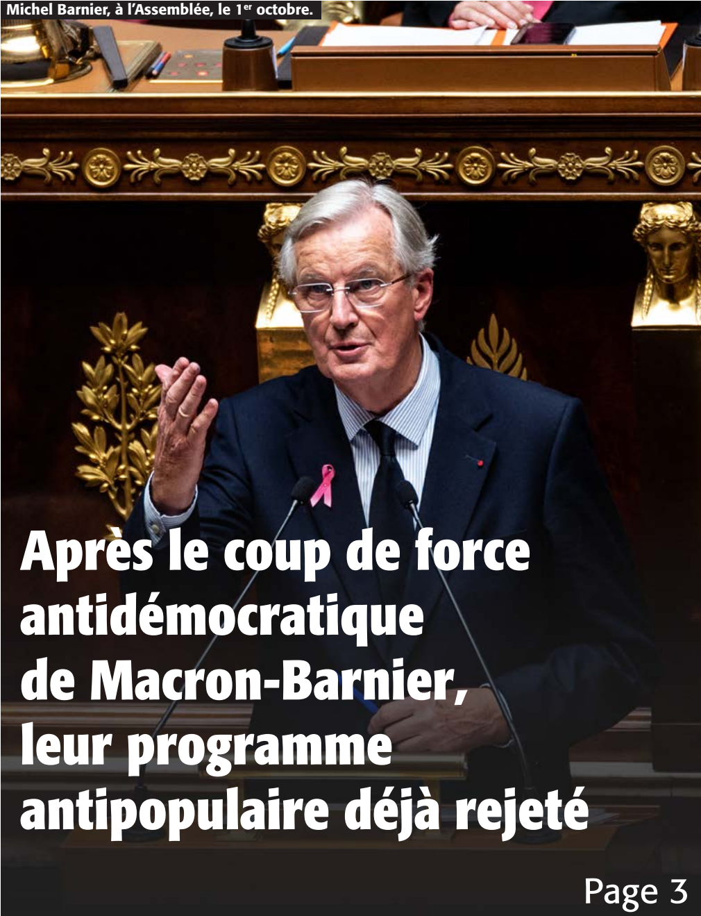
Michel Barnier, à l'Assemblée, le 1 er octobre.

Après le coup de force antidémocratique de Macron-Barnier, leur programme antipopulaire déjà rejeté