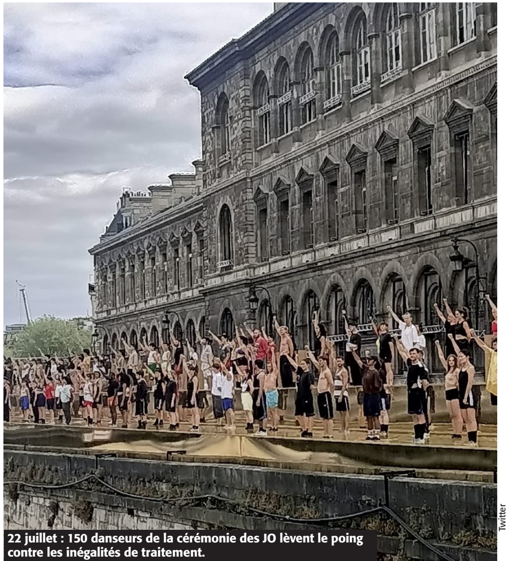
22 juillet : 150 danseurs de la cérémonie des JO lèvent le poing contre les inégalités de traitement.