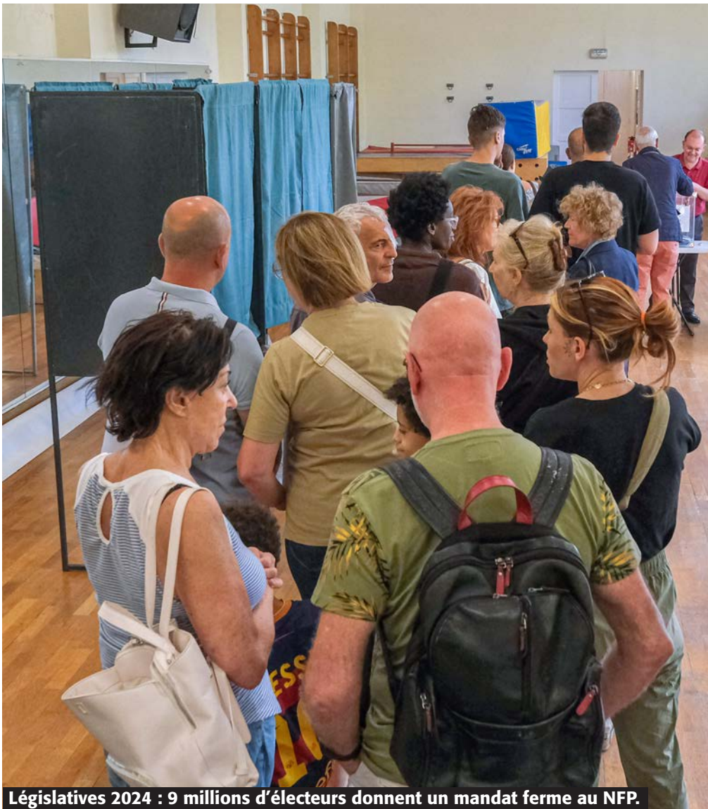
Législatives 2024 : 9 millions d'électeurs donnent un mandat ferme au NFP.

« Front républicain », magouilles habituelles pour sauver Macron et renforcer encore plus le RN : NON