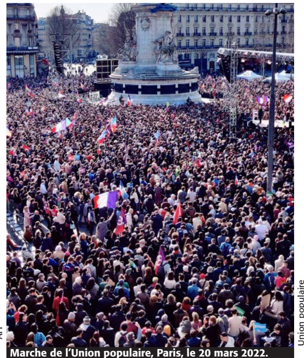
Marche de l'Union populaire, Paris, le 20 mars 2022.