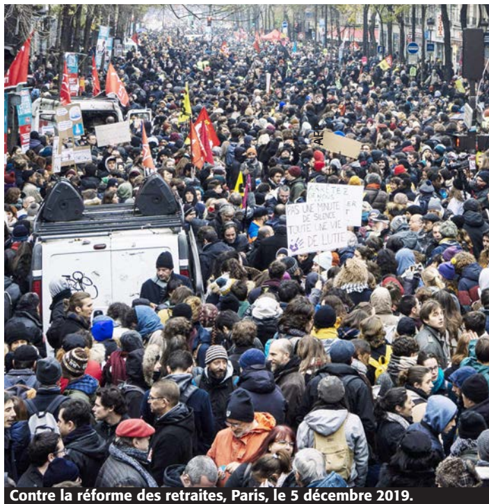
Contre la réforme des retraites, Paris, le 5 décembre 2019.