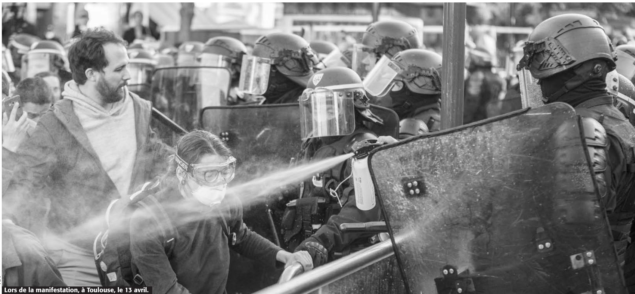
Lors de la manifestation, à Toulouse, le 13 avril.

Avant même l'annonce des mesures de Macron